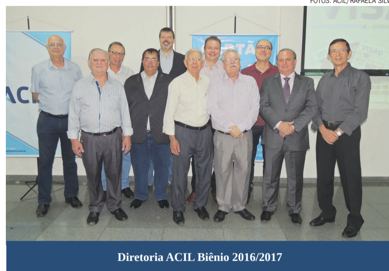
Diretoria ACIL Biênio 2016/2017

Além de todas as facilidades no âmbito comercial, o ACIL+ também traz inúmeras vantagens com sua rede de convênios. “O cartão permite que o possuidor escolha como irá utilizar os seus créditos, em supermercados, restaurantes, postos de abastecimento, e também oferece ao usuário a opção de obter excelentes descontos em escolas, faculdades,