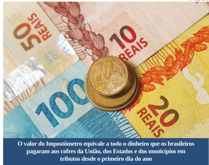
O valor do Impostômetro equivale a todo o dinheiro que os brasileiros pagaram aos cofres da União, dos Estados e dos municípios em tributos desde o primeiro dia do ano