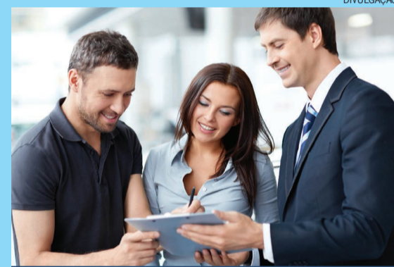
Estes serviços são oferecidos pela maioria das seguradoras como uma forma de atender as necessidades de seus clientes

Essas assistências são oferecidas pelas seguradoras para tomar o produto diferente e atender mais demandas dos clientes, mas para isto existem algumas condições que o contratante deve seguir para garantir o serviço. “Além de manter o pagamento em dia, o contratante do seguro deve sempre avisar quando houver mudança para local de risco, e guardar notas fiscais ou manuais dos novos equipamentos adquiridos”, acrescenta o sócio proprietário da Segfaz.